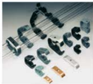
OVAL-Schelle Collare ovale Abrazadera OVAL