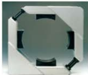
Diagonalschelle Collare diagonale Abrazadera diagonal