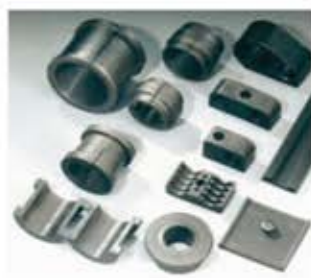
Sortiment Gummitteile Serie di parti in gomma Piezas de elastomero