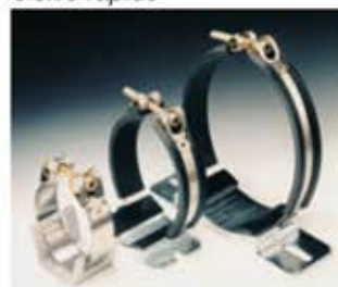
Gelenkband-Konsolenschelle Fascetta a nastro articolato su supporto Abrazadera de cinta articulada sobre soporte