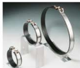
Gelenkbandkonsolenschelle „Multi“ Fascetta a nastro articolato su supporto serie "Multi" Abrazadera de cinta articulada sobre soporte, serie "Multi"