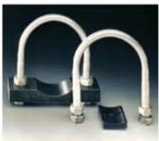
Rundstahlbügel-Schelle Fascetta ad archetto Abrazadera tipo arco