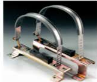
Luftbehälterbefestigung Fissaggio per serbatoio d'aria Fijaciones para depósito de aire