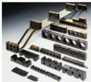
Reihenleiste Collare multiplo Regleta