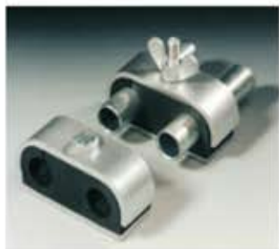
Buegu-Schelle Collare Buegu Abrazadera Buegu