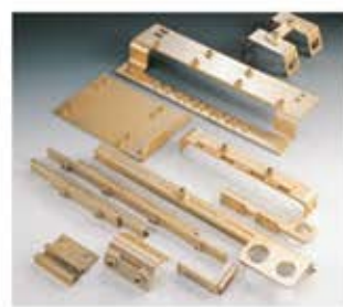
Montagebaugruppen Gruppi di montaggio Grupos de montaje