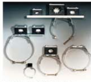
Halterung für Zylinder Supporto per cilindro Fijación para cilindro