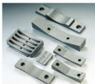
Rohrunterlage Supporto per tubi Soporte de tuberías