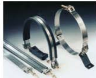
Gelenkbolzen-Spannband Espansore a perno snodato Cinta de apriete articulada