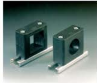
Sensor-Schelle Fissaggio per sensore Abrazadera-sensor