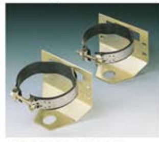
Montagebaugruppen Gruppi di montaggio Grupos de montaje