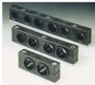
Reihenleiste Collare multiplo Regleta