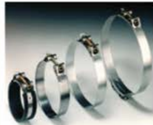
Gelenkbolzenschelle mit Schnellverschluss Fascetta a perno snodato con chiusura rapida Abrazadera articulada con cierre rápido