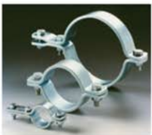
Flachstahlbügel-Schelle DIN 3567 Fascetta circolare piatta in acciaio DIN 3567 Abrazadera circular plana en acero DIN 3567