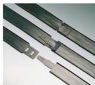
Polyethylen-Band Nastro in polietilene Cinta en polietileno